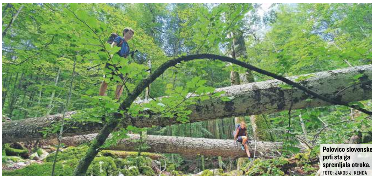
Polovico slovenske poti sta ga spremljala otroka.

Ko je hodil še z otrokoma, so na Gorjancih doživeli srečanje z medvedom, za kar je dejal, da to sploh ni bilo najhujše na vsej poti.