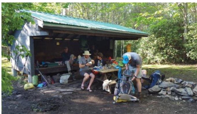
Značilen večer pred značilnim zavetiščem ob poti