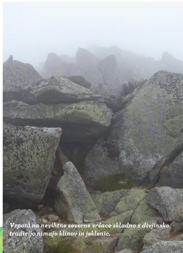
Vzponi na nevihtne severne vršace skladno z divjinsko tradicijo nimajo klinov in jeklenic.